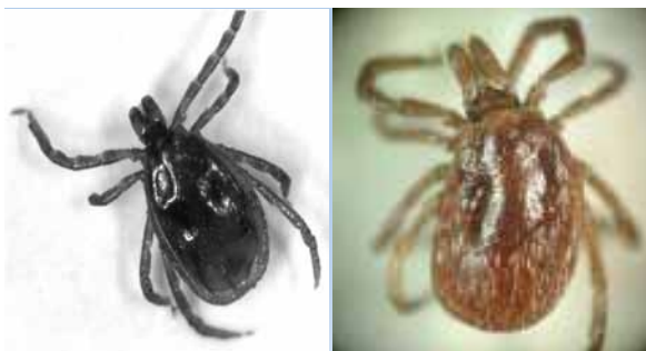
Рисунок 1 – Внешний вид иксодовых клещей с разными формами патологии экзоскелета (а – самец, б – самка)

Учитывая данные литературы [2, 3], что аномальные клещи в силу ослабленного иммунитета подвержены более массивному инфицированию патогенными агентами, нами были проведены исследования по изучению зараженности клещей возбудителями Лайм-боррелиоза. Исследования показали, что среди аномальных особей боррелии встречаются почти в 2 раза чаще, чем среди нормальных клещей, а среди аномальных клещей, отловленных в ПГРЭЗ и его окрестностях, доля зараженных была выше в 3,4 раза (таблица 2).